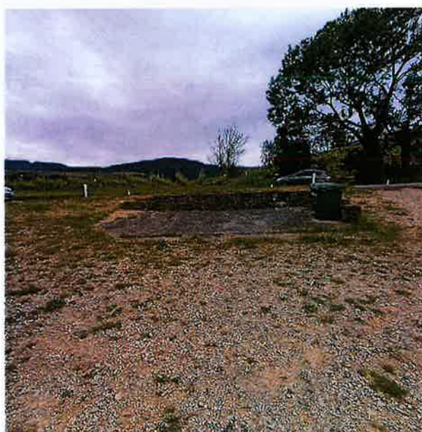
Slika 2 Trenutno stanje na parceli