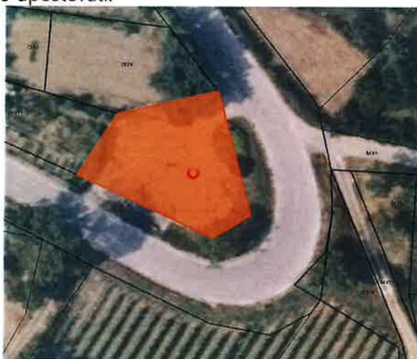
Slika 1 Trenutno stanje podstešje

Parcela se nahaja ob regionalni cesti Štanjel–Manče, v območju cestnega ovinka. Na jugovzhodnem delu parcele, ob glavni cesti, stoji tudi Manški pil, ki ga bo treba pri projektiranju ustrezno upoštevati.