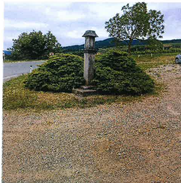
Slika 3 Manški pil